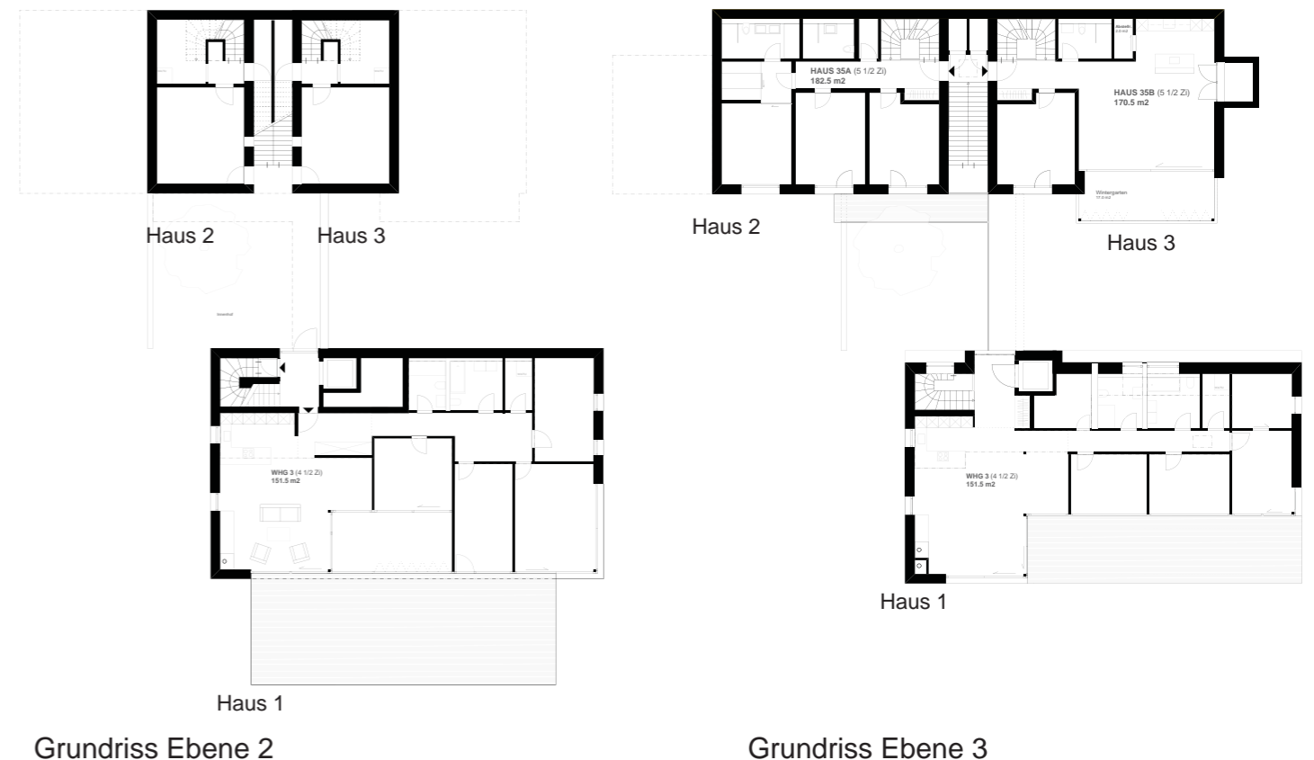
Grundriss Ebene 2